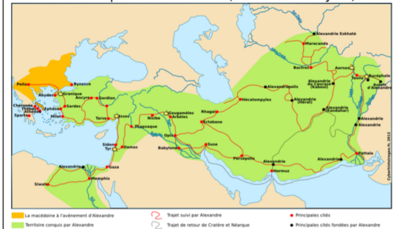
Les conquêtes d'Alexandre (334-323 avant J.-C.)

Son célèbre cheval Bucéphale l'accompagnera tout au long de son épopée.